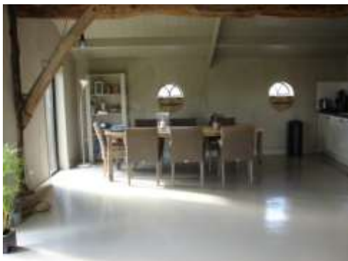
Hooiberg het Steenuiltje in Ophemert

De training is interactief. Theorie en praktijk wisselen elkaar af. We werken met praktijkvoorbeelden van deelnemers en filmfragmenten. We oefenen in aandacht en waarnemen, contact aangaan, positie innemen, afstand en nabijheid en het begeleiden van familiegesprekken. Je krijgt lichte, praktische opdrachten mee.